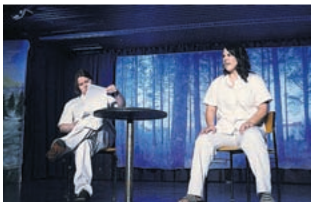
Vårdarna på äldreboendet (Tanja Harju och Mimmi Heikkilä) har inte riktigt koll på sina patienter.

folk till kyrkbänkarna har kantorn fått i uppdrag att skriva om skapelseberättelsen. Något som kyrkoherden får ångra.