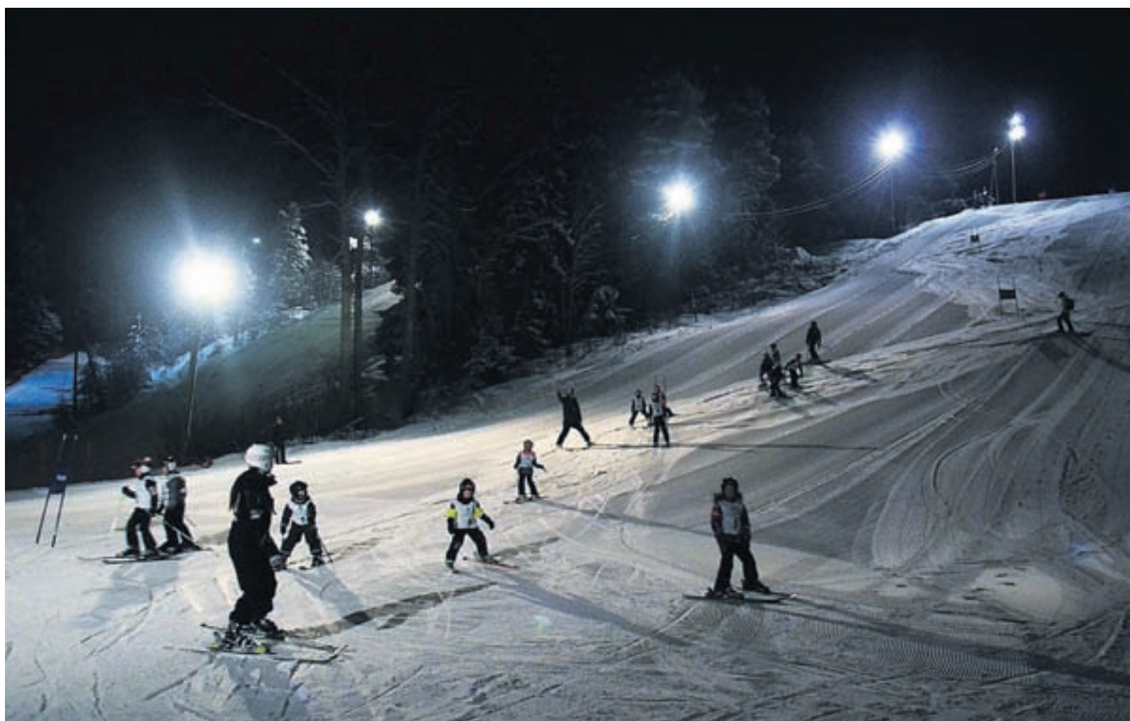
Deltagare i alla åldrar bekantar sig med kvällens bana. Föreningen brukar ordna fyra tävlingar per säsong.

Skidbacken i hemkommunen är viktig för Vöra If:s slalomsektion. Några ordningsproblem har man inte upplevt.