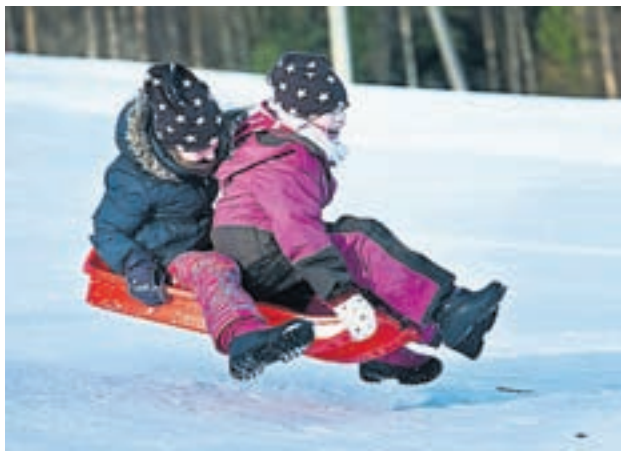
Pulkåkning är kul. Vid Centrumskolan i Oravais ordnas en vinterkuldag med bland annat pulkåkning.

LÖRDAG 21 FEBRUARI Revypremiär "Revsion – ingen nämnd ingen glömd" kl 19 i Vörå uf. Info och onlinebokning på www.vorauf.fi . Under sportlovsveckan hålls föreställningar även 27.2 och 28.2. Alla kl 19. Arr. Vörå uf. Byarevyn "I tid och jävighet" kl 20 (after föus) på Årvasgården. Bokningar: 050-377 3679. Under sportlovsveckan hålls föreställningar även 27.2 och 28.2. Alla kl 19. Arr. Ungdomsföreningarna i Kimo, Oravais, Keskis, Komossa och Hellnäs.