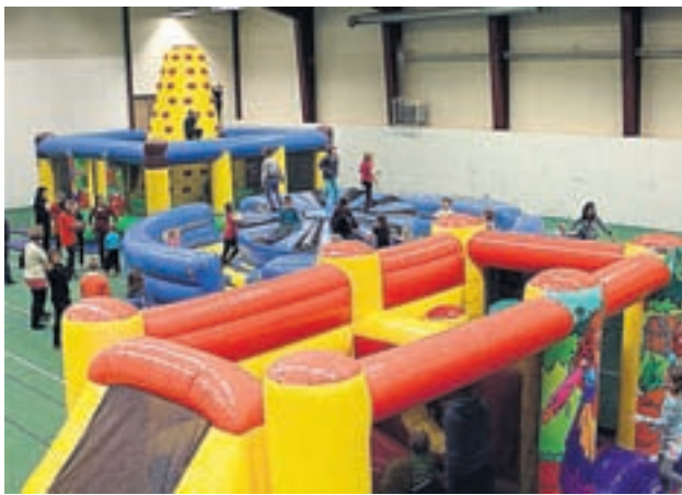
Pomppulinna Hopsis. Lapset saavat pomppia niin paljon kuin suinkin jaksaa.

LAUANTAI 21. HELMIKUUTA "I tid och jävighet"-revyy Årvasgårdenilla klo 20 (after föus). Varaukset: 050-377 3679. Esitykset hiihtolomaviikolla myös 27 ja 28.2. Järj: Kimon, Oravaisten, Keskisin, Komossan ja Hellnäsin nuorisoseurat. "Revysion - ingen nämnd ingen glömd"-revyy klo 19. Esitykset hiihtolomaviikolla myös 27 ja 28.2. Info ja online lippuvaraus verkkosivuilla www.vorauf.fi Järj: Vörå uf.