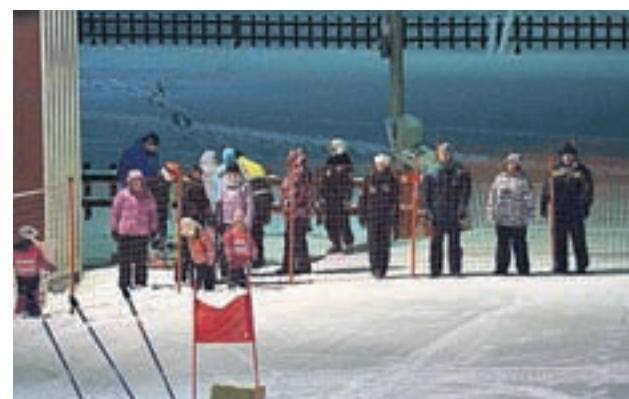
Trots att det var kallt och blåsigt vid skidcentrum fanns ändå en del föräldrar och syskon på plats för att heja på deltagarna i Vöråcupen.

Men det viktigaste är ändå att trivas i backen. För en tid sedan lanserades vid Öjberget i Sundom ett koncept där frivilliga föräldrar övervakar ordningen i backen och ser